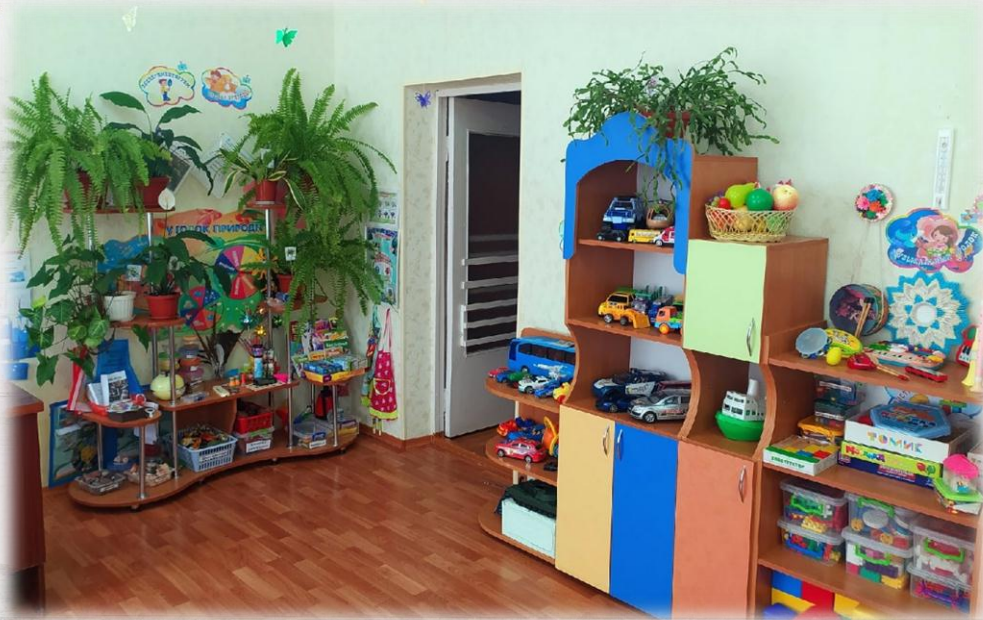
Вид из центра группы

Такое размещение позволяет детям заниматься любимым делом и объединяться по подгруппам. Воспитанники имеют возможность свободного перехода от одного вида деятельности к другому.