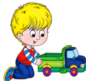
ИК-ИК-ИК Я катаю грузовик