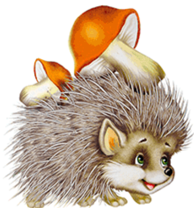
БЫ-БЫ-БЫ Ёж несёт грибы