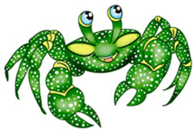
АБ-АБ-АБ Вот большущий краб