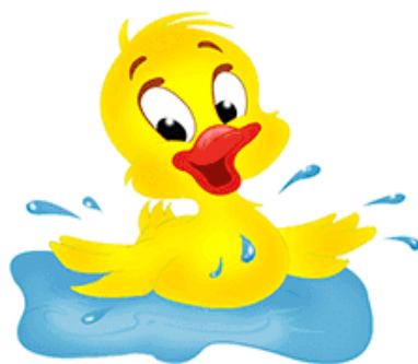
ДЕ-ДЕ-ДЕ Утенок плещется в воде