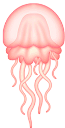
ЗА-ЗА-ЗА Прозрачная медуза