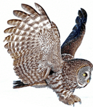
ВА-ВА-ВА К нам летит сова