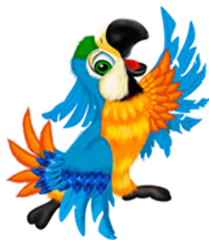
АЙ-АЙ-АЙ Говорящий попугай